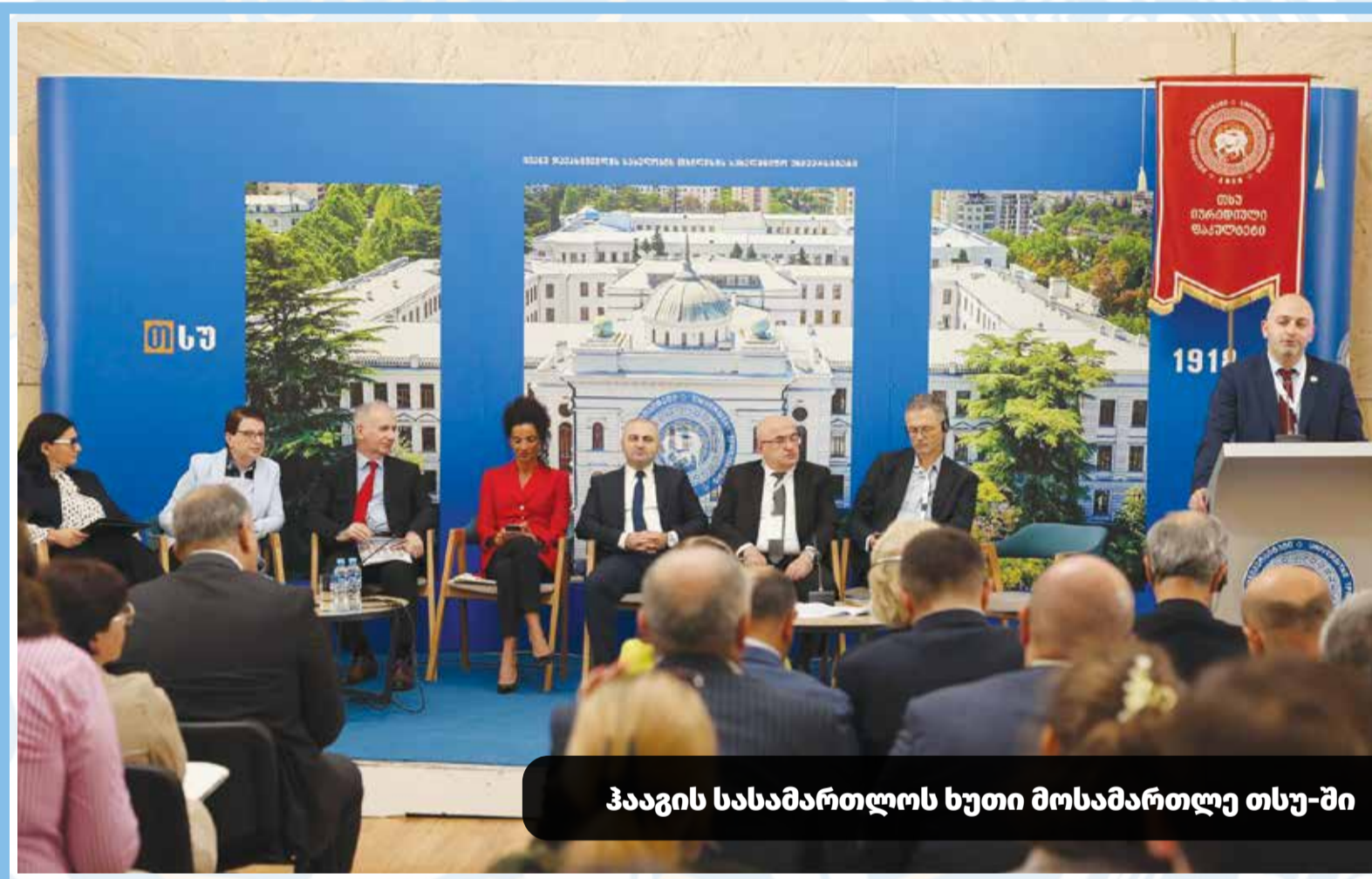
ჰააგის სასამართლოს ხუთი მოსამართლე თსუ-ში

წლის საუნივერსიტეტო მოვლენად დასახელდა საერთაშორისო კონფერენცია ჰააგის სასამართლოს ხუთი მოსამართლის, ქართველი და უცხოელი პროფესორების მონაწილეობით